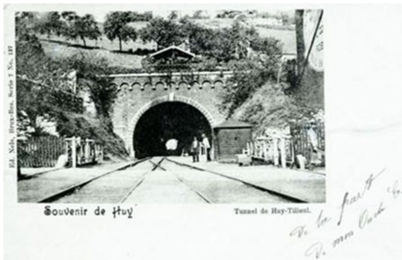
Postkaart van de spoorwegtunnel Hoi-Tilleul (Ref. Z00452)

Spoorlijn 126 verbond Statte met Ciney. Ze doorkruiste de Condroz via de valleien van de Hoyoux en de Bocq. Aangezien het station Hoi-Noord (op de 'Waalse as') erg ingesloten lag, werd het spoorwegknooppunt aangelegd in Statte. De verbinding 'Haspengouw - Condroz' (Landen - Hoi - Ciney), van ondergeschikt belang, kruiste er de hoofdlijn, die werd aangelegd door de Compagnie du Nord-Belge .