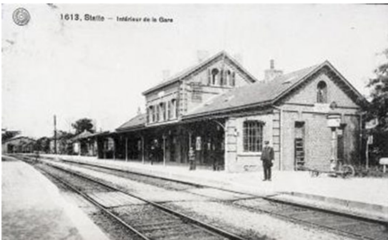
Postkaart van het station Statte (Ref. Z00322)