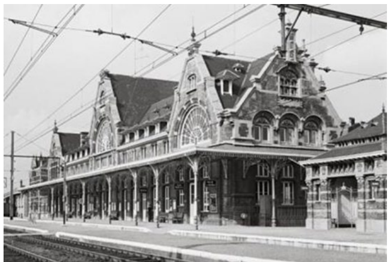
Station Ciney (Ref. Z03689)

De lijn werd vervolgens stapsgewijs gesloten bij gebrek aan goederenverkeer. In 1965 werd het baanvak Marchin - Clavier als eerste gesloten. Daarna volgden de baanvakken Clavier - Hamois-en-Condroz in 1973 en Hamois-en-Condroz - Ciney op 6 december 1982. Van deze lijn wordt enkel de sectie Statte - Marchin nog steeds gebruikt (vereenvoudigde exploitatie - 40 km/u).