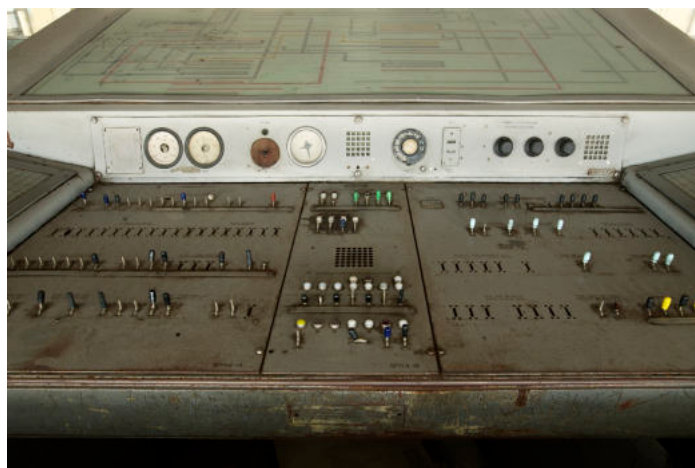
Brussel Zuid - Post X