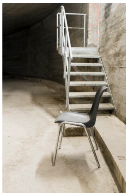
Brussel-Centraal | Onafgewerkte Parking