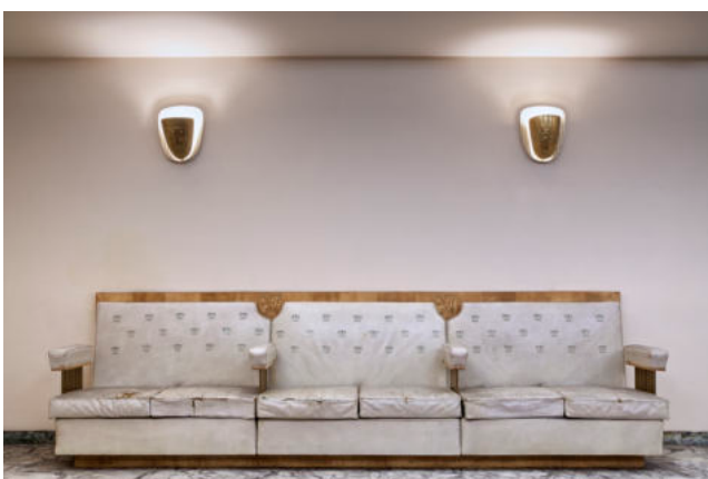
Brussel-Centraal | Koninklijke Loge

Een unieke kans om de verborgen wereld van onze stations te ontdekken!