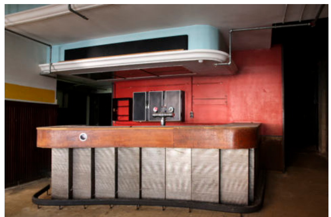
Brussel-Kapellekerk | Recyclart vzw - Roltrappenbar