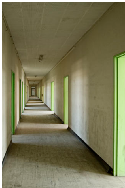
Brussel-Zuid | Fonsny Gebouw

Fotograaf Joost Fonteyn heeft als een stations-archeoloog deze wereld vol geheimen voor ons blootgelegd. In een reeks foto's van plekken en dingen die van onder het stof licht verbaasd in de spiegel van zijn lens kijken: hé, zijn wij hier nog?