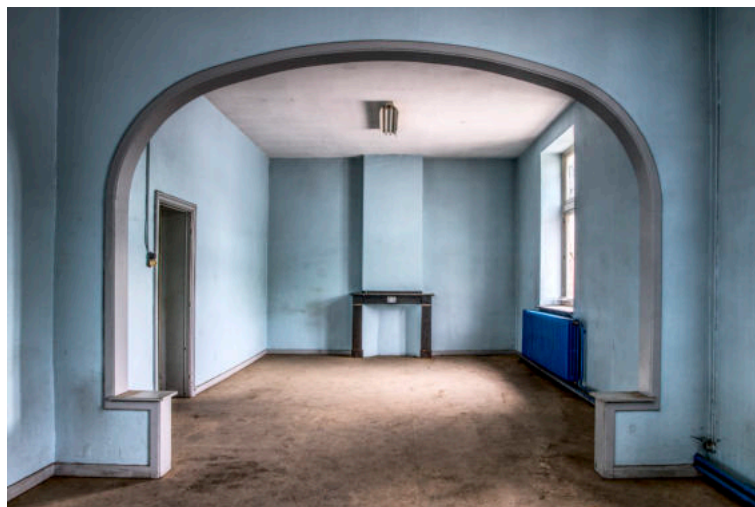
Station Jette | Statige woonruimte?

Meer op JoostFonteynPhotography.be en Trainworld.be