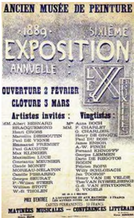
Affiche de l'exposition du groupe Les XX , 1889