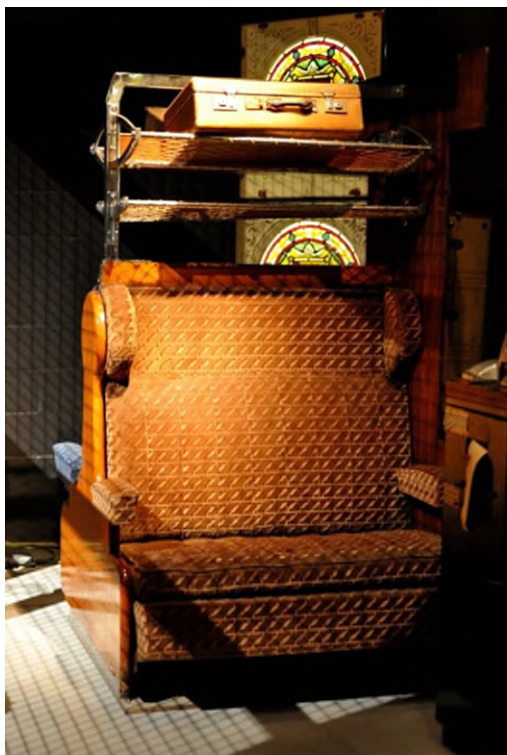
Banquette de train bilatérale surmontée d'un filet à bagages d'une voiture K 1 (Réf. 4798)

Comme conseiller, il va donner son avis sur la décoration du matériel ferroviaire en cours de construction. Il va également concevoir grand nombre d'objets de décoration : les banquettes, la quincaillerie et, en général, les objets devant présenter un caractère ornemental (dont ceux des compartiments de 1 re et 2 e classe des voitures K1 du service intérieur).