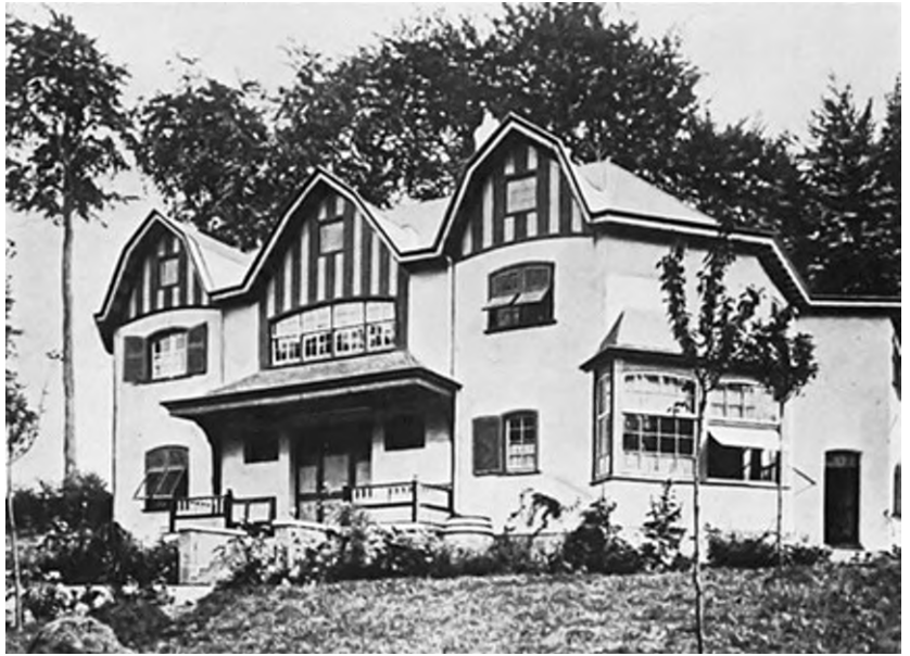
Villa Bloemenwerf à Uccle – 1896

Sa maison est à appréhender comme une oeuvre d'art totale où chaque détail – du mobilier aux robes de son épouse – participe à l'harmonie du lieu. Désireux de libérer le corps de la femme, il avait en effet conçu pour la sienne des tenues d'intérieur amples en tissu anglais et des toilettes de soirée, non resserrées à la taille, pour lui permettre de vivre confortablement, et de travailler.